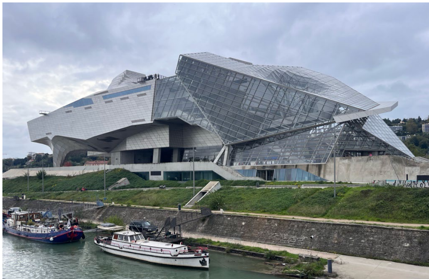
里昂的 musée de confluence