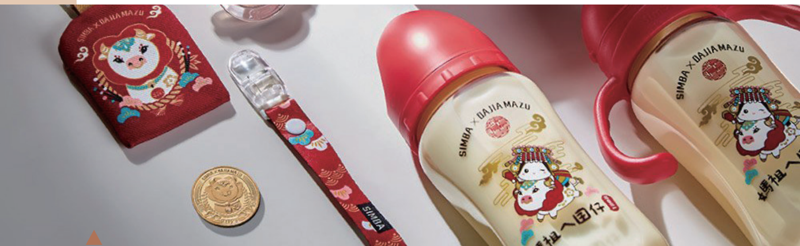
Le Roi Lion Simba X Dajia Jennlann Palace Joint Series

Enfin, dans des conditions économiques, nous pouvons coopérer avec la marque. Bien que notre objectif ne soit pas de gagner de l'argent, cette approche peut attirer l'attention de plus de gens. La plupart des gens suivent les tendances. Nous pouvons co-marquer des produits liés au temple avec des marques bien connues, telles que des pendentifs en verre co-marqués Mazu. L'image ci-dessous est un cas de coopération entre d'autres temples et marques qui a été aimé par beaucoup de gens à ce moment-là.