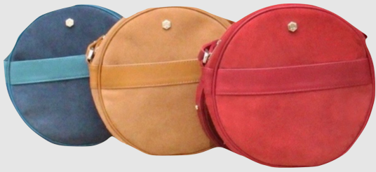
Sac Alice cuir rouge