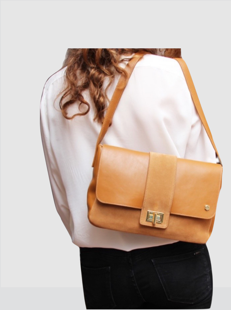
Sac bandoulière cuir camel