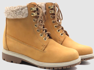
Bottillons crampons cuir nubuck beige