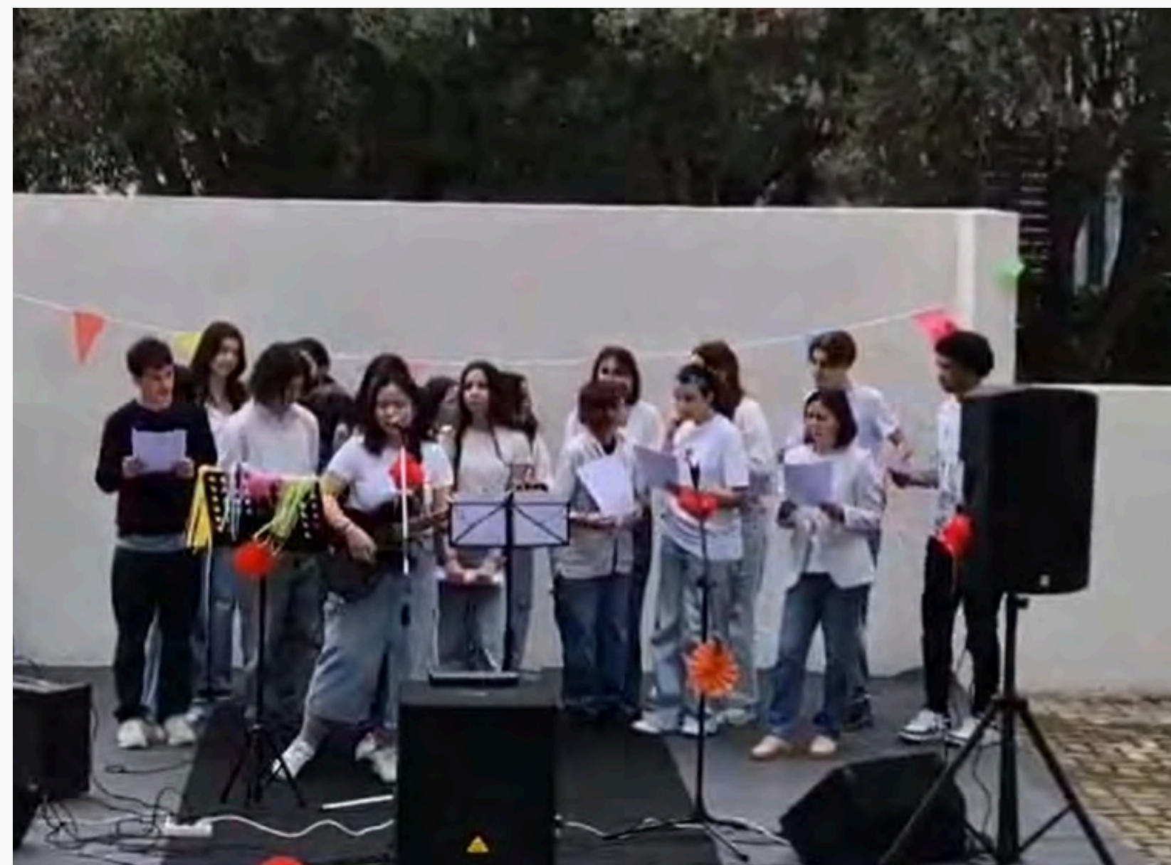
↑ 語言週演唱會帶學生唱《明天會更好》