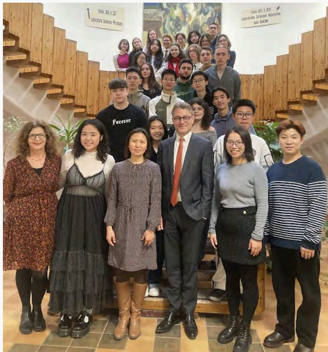
↑ 中國高中生來進行交換