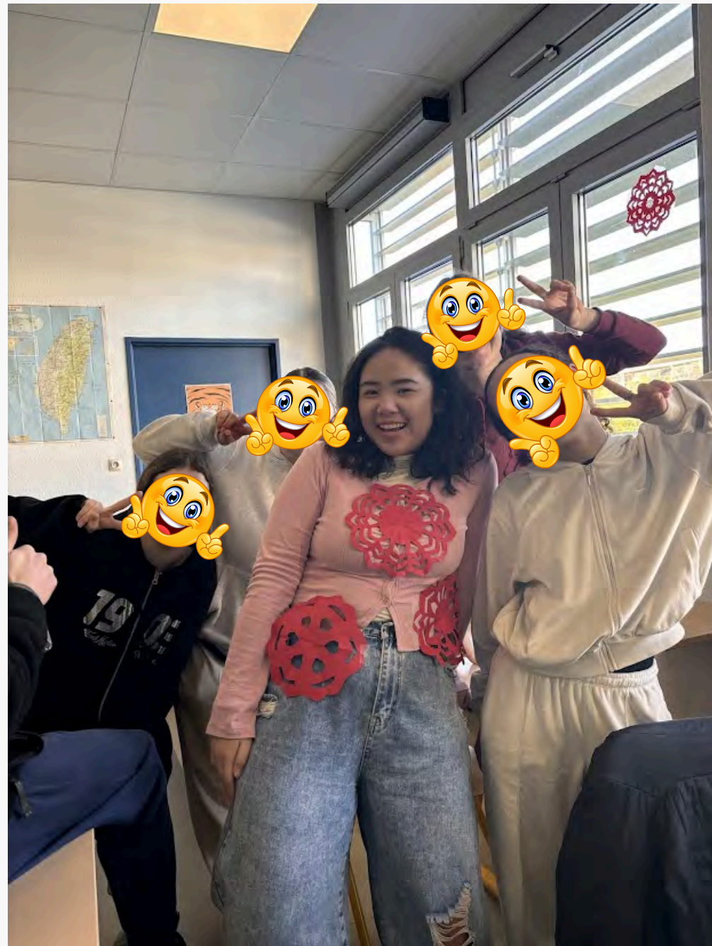
↑ 農曆新年一起剪紙布置校園