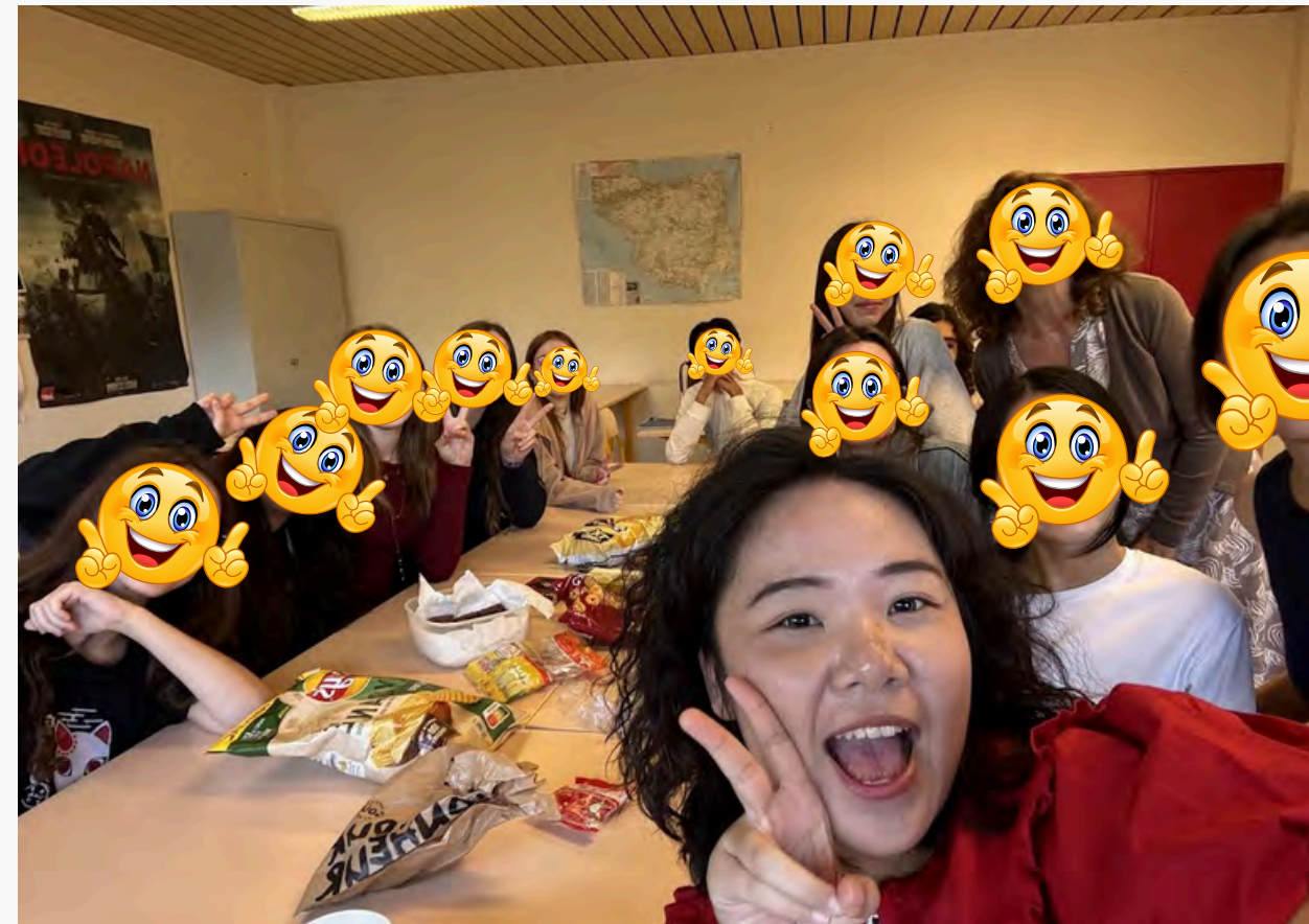
← 一起品嚐台灣珍奶 與零食交流