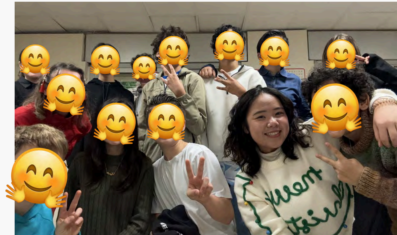
聖誕前一起學唱 中文版聖誕歌 →